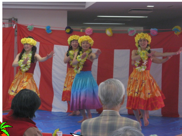
口和エンジェルスの皆様 南国ムードたっぷりです