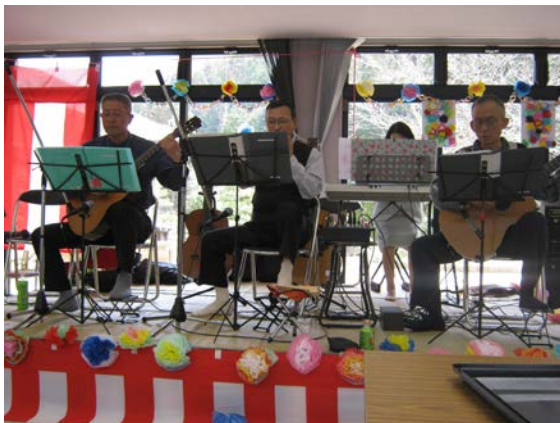
三良坂ギターアンサンブルの皆様