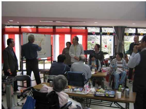
利用者の皆様と一緒にハンドベル演奏