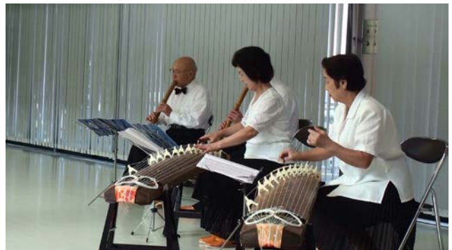
琴と尺八による演奏をして下さいました。