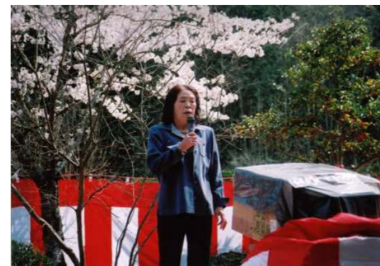
家族の方にも 参加していただきました。