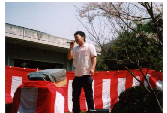
歌って踊れる職員 目指すはスーパースター(…かも)