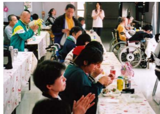
いろいろなステージを 見ながらのお弁当 楽しくいただきました☆