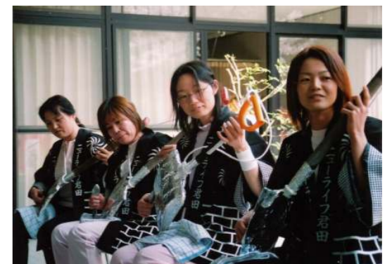
今、流行のエア三味線!! 練習の成果が今、発揮される! (…ハズ)