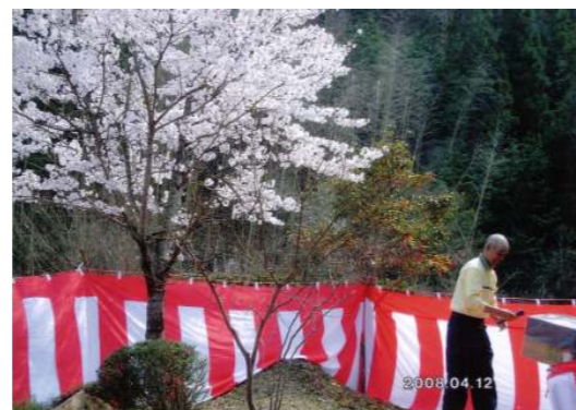
満開の桜の下で 一曲♪