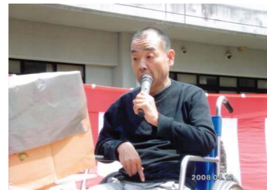
今回のカラオケには、利用者さんも多数参加。新たなスター誕生!?