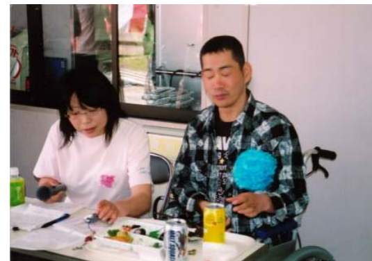
司会のお二方 緊張の面持ち