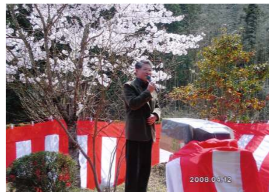
桜を舞台に ココロに染みる歌声