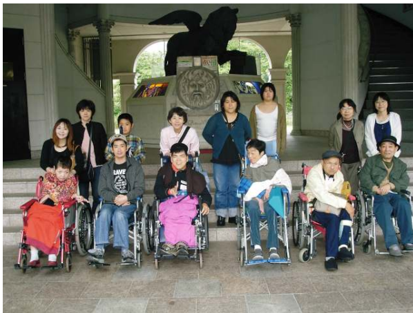
肌寒かったのですが、皆さん笑顔で…ハイチーズ!! 後ろのライオンの像、動くんですヨ～ ご存じでしたか？