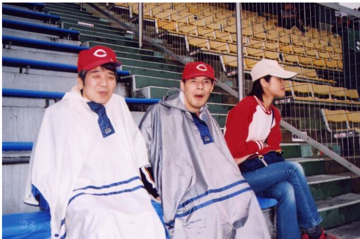
応援するのは全力で！雨にも負けずに頑張ろー！！

毎年一回は必ず広島市民球場に行つて広島カープの応援して楽しんで食事をしていきます。五月の鯉登りの時期はカープは強いが夏場になると弱く連敗します。 今年ががんばって優勝してほしいと思つていきます。