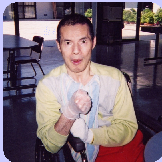
パン作りはこねるのが基本。

今回のメニューは『簡単ロールパン』でした。電子レンジを使い発酵時間を短縮してあるので、作りはじめて1時間ちよつとで焼き上がります。ふつくらキツネ色に上手に焼き上がったパンをみんなで少しずつ食べました。やっぱり焼き立てはおいしいね。