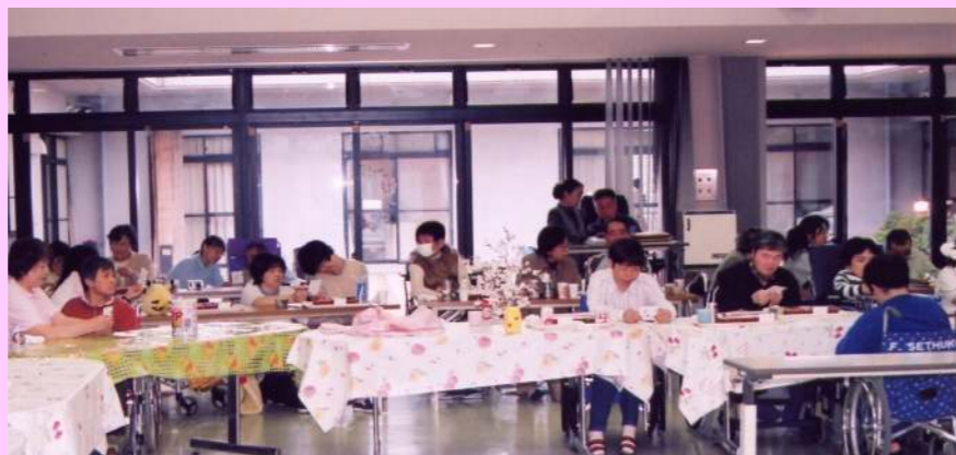
室内でのお花見だけど気分はバッチリ。