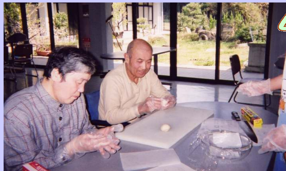
簡・単・クッキング！パン作りに挑戦！！ …でもけっこう難しい…。