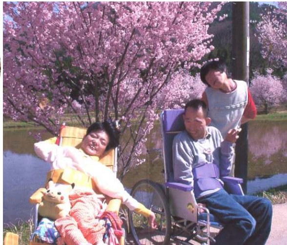
ちょうど満開で一杯飲みたかったですね！！