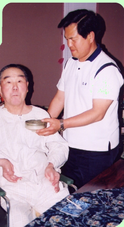
お抹茶とお茶で優雅なひととき♪

♪おだいり様とおひな様♪ 今回の抹茶コーナー、テーマは「花見」きれいなひな人形に皆さん見とれていました。