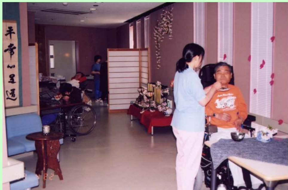
毎回テーマの違うお茶会です♪ 今回は、お・花・見。