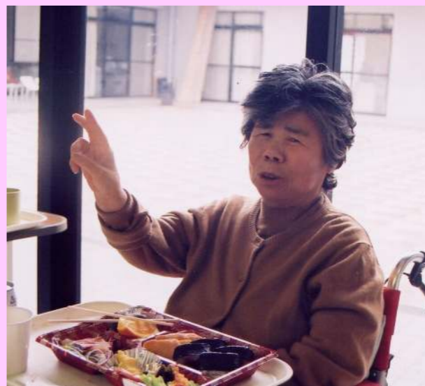
お弁当を前に ハイ・ポーズ。 今年のごちそうはどうでしたか？

今年はいにくの空模様で、残念ながら施設内のお花見となりました。が、園内を桜の花で飾り、ビンゴゲームやカラオケなどで、ゆつくりと春の一日を楽しみました。