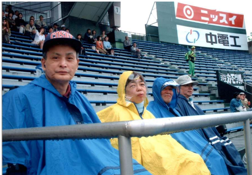
白球の行先に一喜一憂。試合の結果や如何に！

毎年一回は必ず広島市民球場に行つて広島カープの応援して楽しんで食事をしていきます。五月の鯉登りの時期はカープは強いが夏場になると弱く連敗します。 今年ががんばって優勝してほしいと思つていきます。