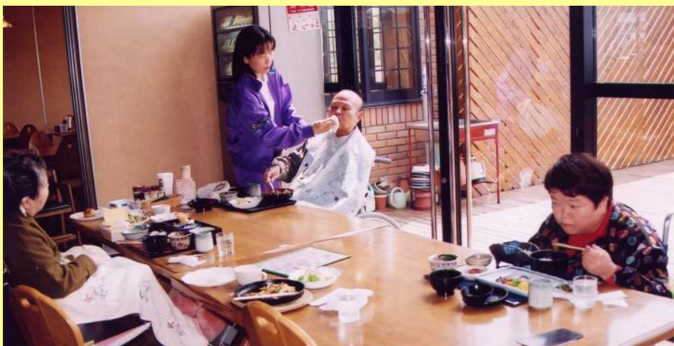
外出先でのお食事風景♪ 好きな食べ物は何か～？

今年の社活は、4月9日から始まりました。三次・庄原方面へのシヨッピングやカーブ観戦など楽しいこと盛りだくさんです。