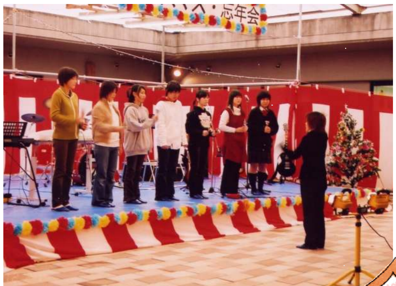
ハンドベルによるクリスマスソング。 神秘のしらべ。