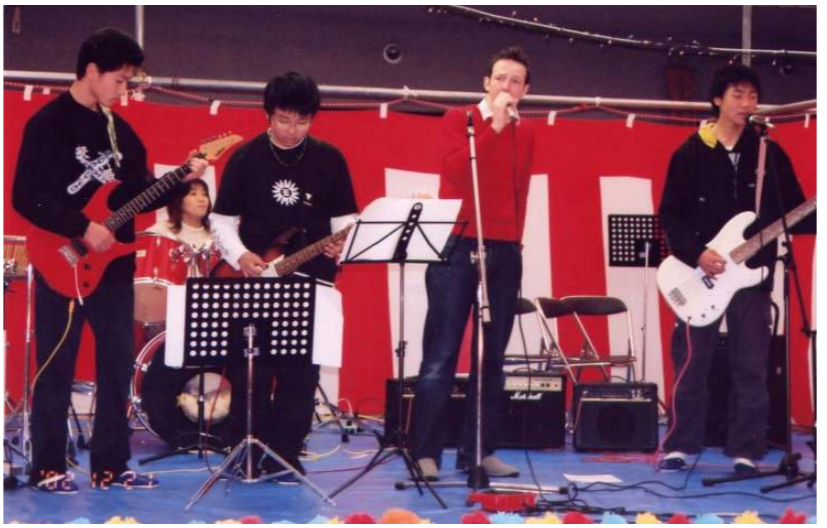
音楽クラブの皆様☆ ビートルズ熱演！