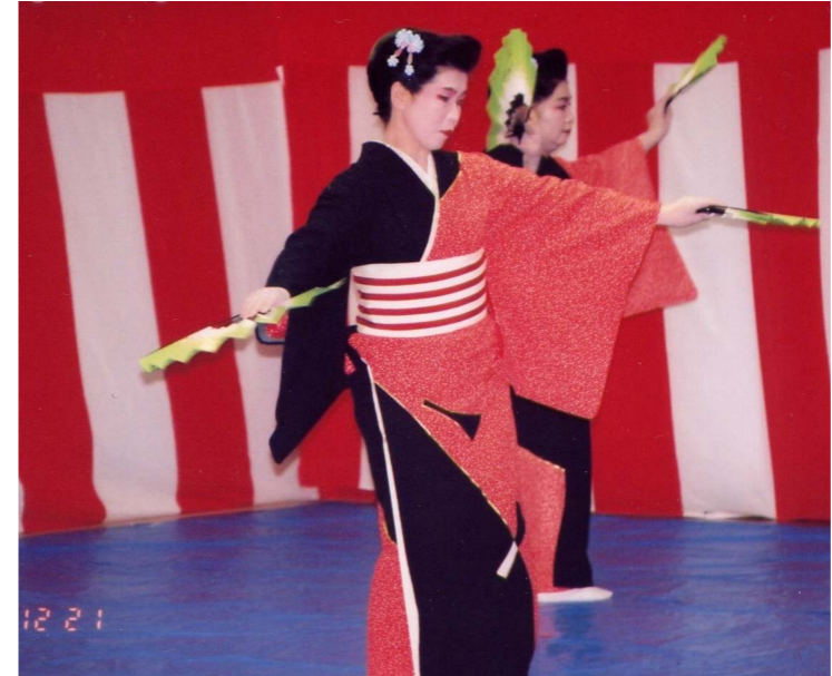
津軽の花の舞い。さあ、これは誰でしょう！？

冬！ 冬といえば年末！ 年末とくればクリスマス会☆という訳で今年もやっ て参りました♪ 今年は二人羽織、ソーラ ン節、カラオケ大会が登場！ ゲストは中学生音楽クラブ、寿百弥会の皆 様方。次回も新しい企画が出てくるかど うか、乞うご期待。