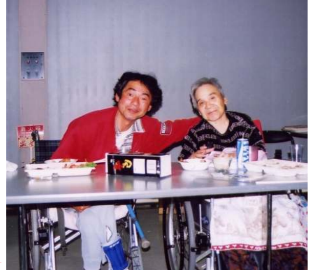
茶飲み友達？ 仲良く2人で。