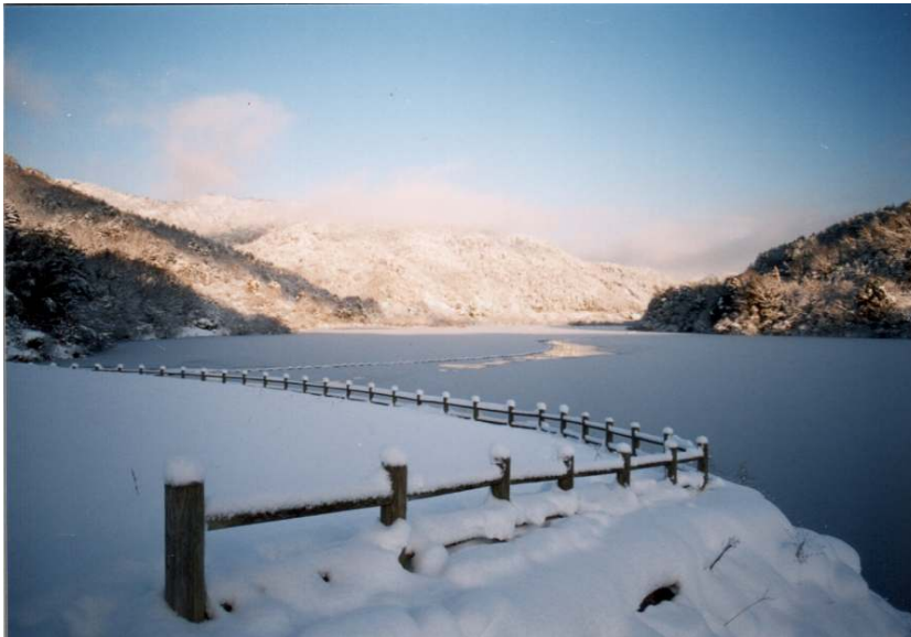
土師ダムにて