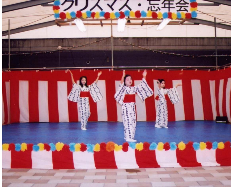
可愛らしい踊りでステージは華やかに。