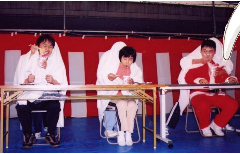
二人羽織でGO！ サンタまっ白！！