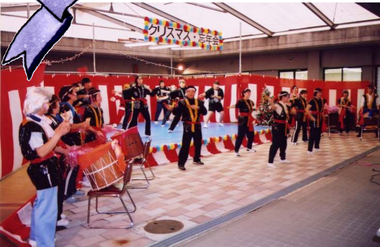
初見参☆ソーランロック！ 練習時間は、ひ・み・つ♪