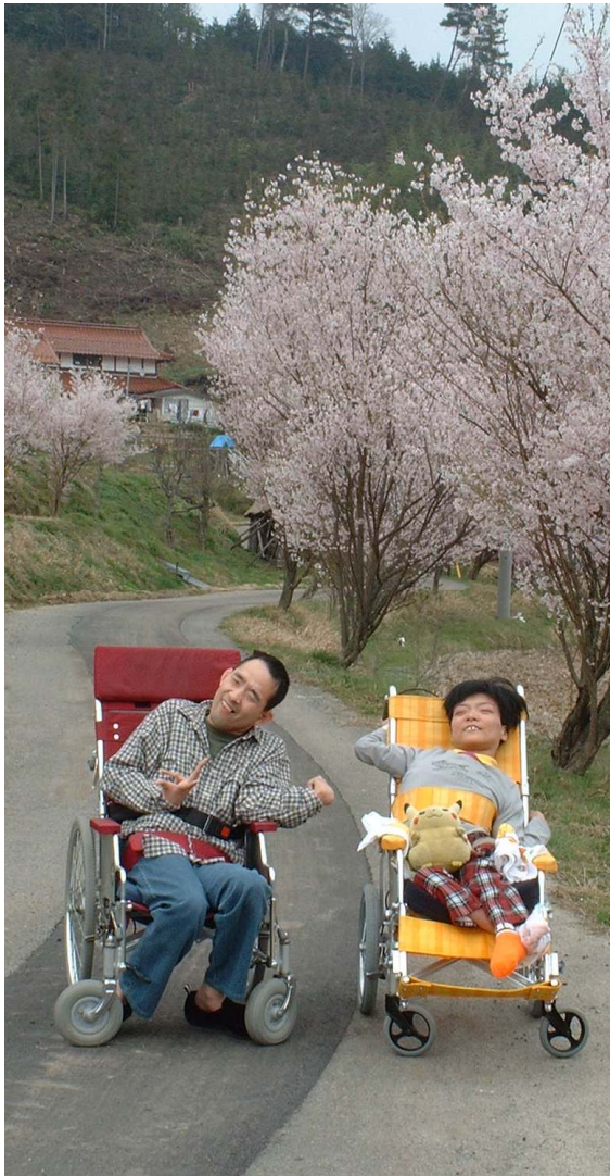
春一番！桜街道満開 君田村茂田

水仙が私達の目を楽しませてくれました。子供遊園地では、桜の花は見れなかったものの川のせせらぎを聞きながら自然の中でおいしい手作り弁当を食べたり、ゲームをしたり、歌を歌ったりと楽しい一日を過ごすことが出来ました。ご家族の皆さんご協力ありがとうございました。このところ暑かったり、寒かったりと天候が不安定ですので風邪をひきやすい様です。みな様気を付けて下さいね。春は心も体もウキウキします。春をいっぱい楽しみましょう!!